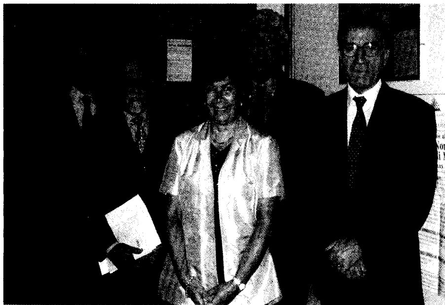
Fig. 2 La Commissione del primo concorso nazionale per un posto di professore universitario di ruolo di seconda fascia presso la Facoltà di Medicina e Chirurgia Università di Roma "La Sapienza" settore F23A (Scienze Infermieristiche Generali e cliniche) bandito con DR del 6 settembre 1999 G.U. Supplemento Ordinario n° 75 del 21 Settembre 1999.

Ma non era finita, dovevamo aspettare la nomina della Commissione giudicatrice per la quale non c'erano Infermieri eleggibili e che pertanto sarebbe stata composta da soli medici. Certo, Professori illuminati ma non Infermieri. Il ritiro di uno dei componenti della Commissione, la nuova nomina, il nuovo decreto. Quanto stress! E' durato un anno. E poi, l'attesa dei criteri di selezione che vengono riportati di seguito e che, sebbene modificabili, possono rappresentare un esempio per i Colleghi che volessero partecipare ai prossimi Concorsi per professore nell'Università e...nel frattempo, tante riflessioni mentre aumentava il batticuore e pensavo ai